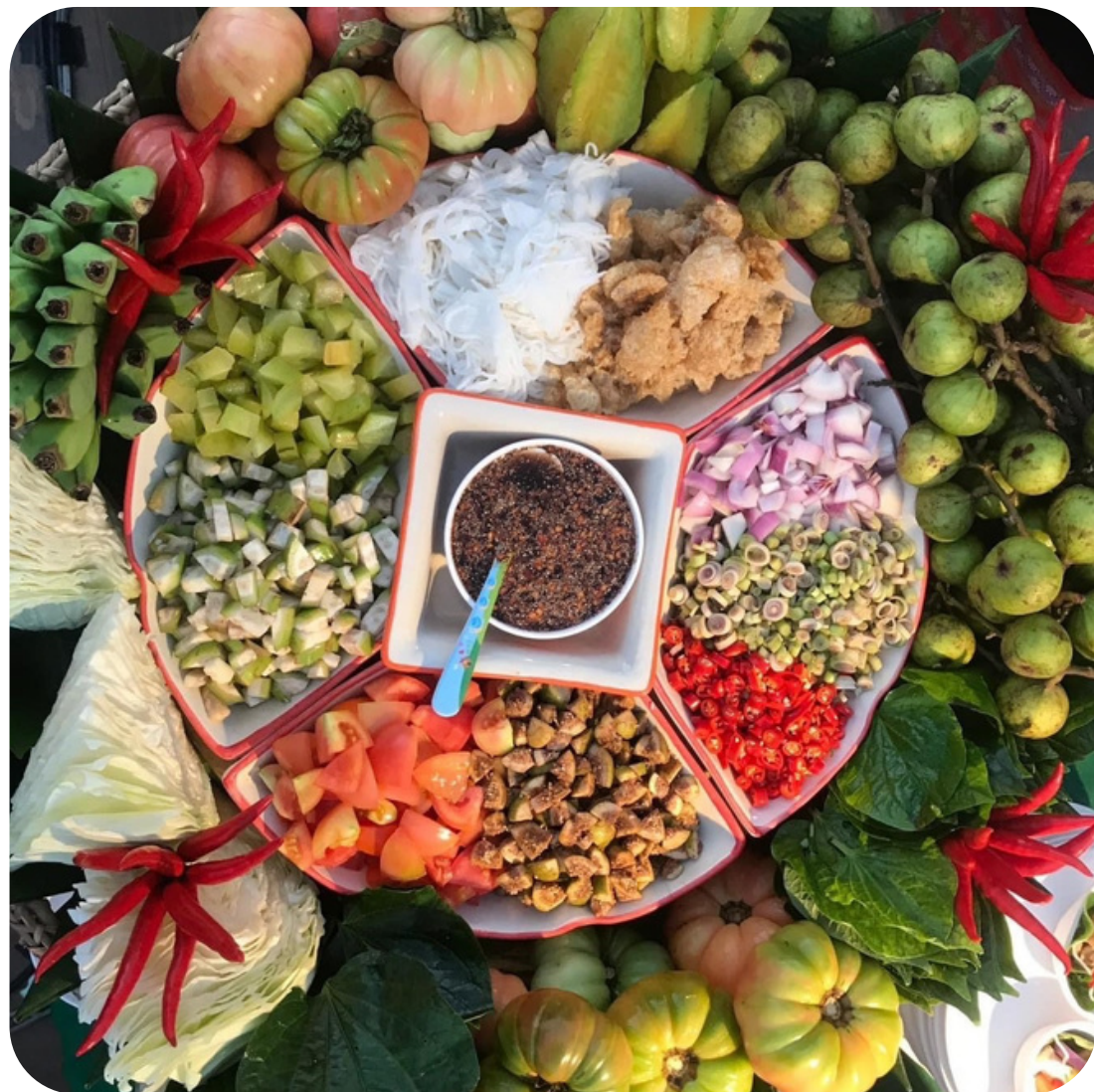
MAING TAI SAK : EASY TO EAT